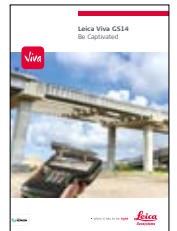
Leica Viva GS14