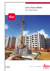
Leica Nova MS60