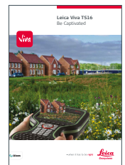
Leica Viva TS16